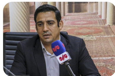
مدیرکل ورزش و جوانان خوزستان:

در این مراسم، مردم با بصیرت خوزستانی با محکومیت شدید جنایات رژیم اشغالگر قدس علیه مردم بی‌دفاع غزه، بار دیگر نشان دادند که صدای مظلومیت را فراموش نکرده‌اند و در کنار ملت فلسطین ایستاده‌اند.