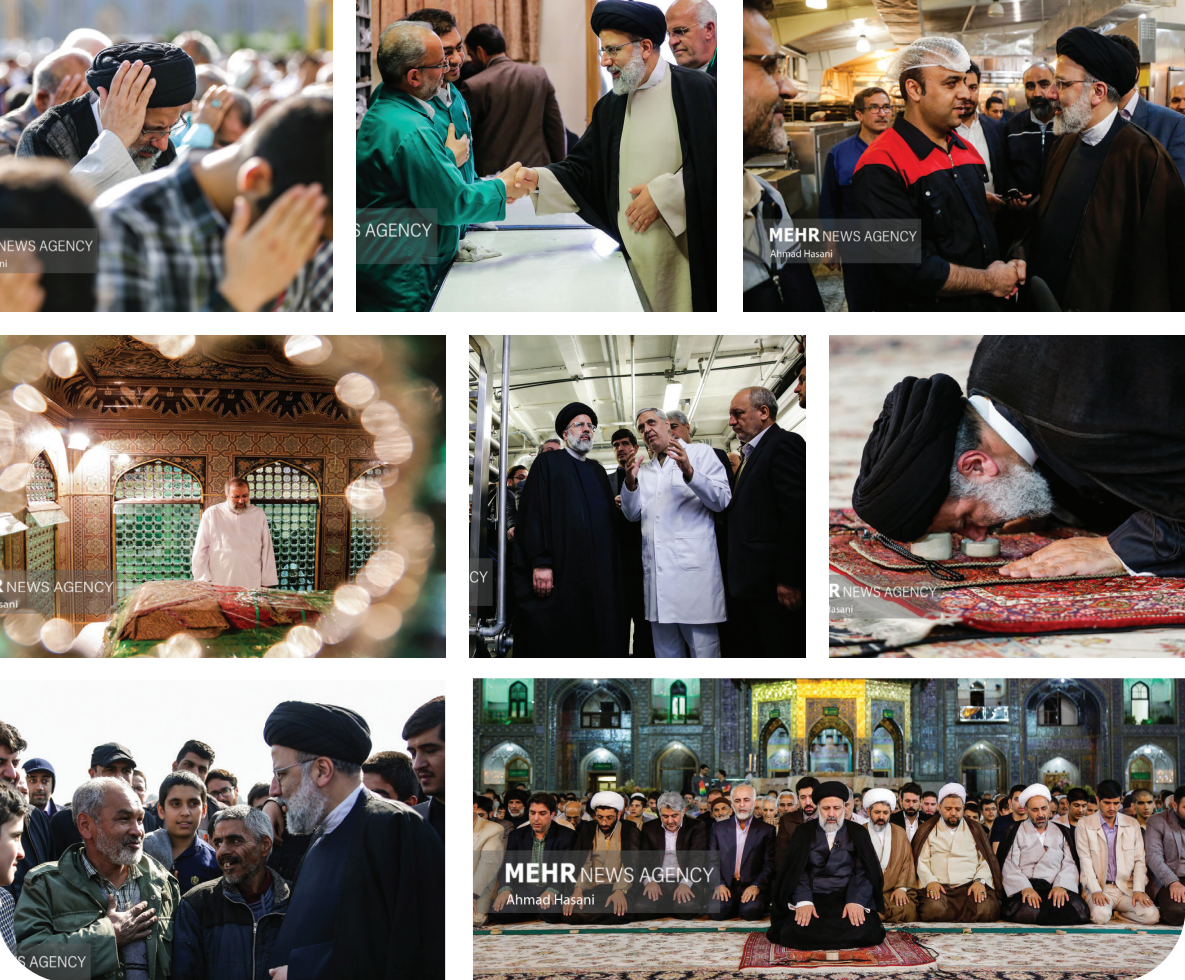
MEHR NEWS AGENCY