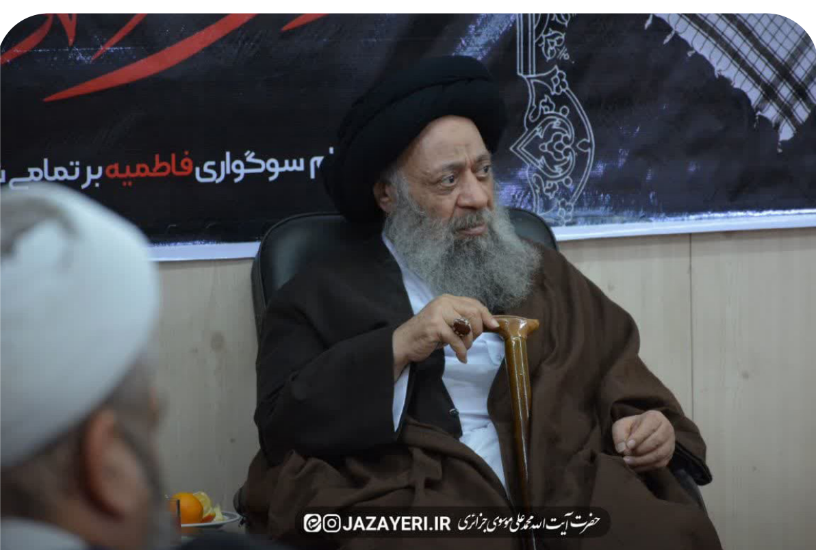
حضرت آیت الله موسوی جزایری

ندای رساجت الاسلام والمسلمین سید محمد نبی موسوی فرد به همراه مسئولین و اعضای مرکز رسیدگی به امور مساجد استان خوزستان شامگاه یکشنبه ۱۸ آذر