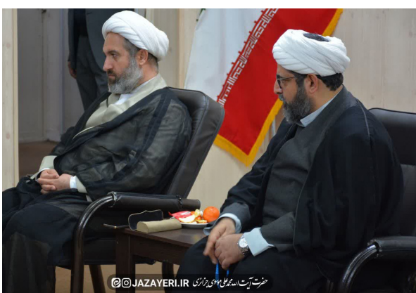
حضرت آیت الله موسوی جزایری