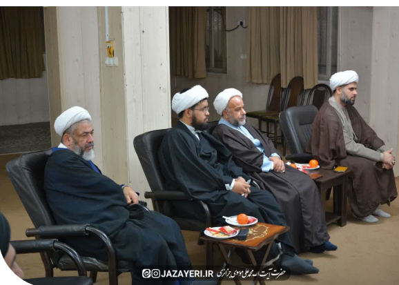
حضرت آیت الله موسوی جزایری