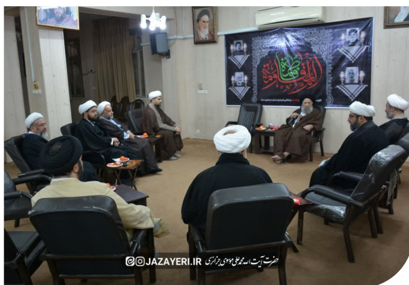
حضرت آیت الله موسوی جزایری