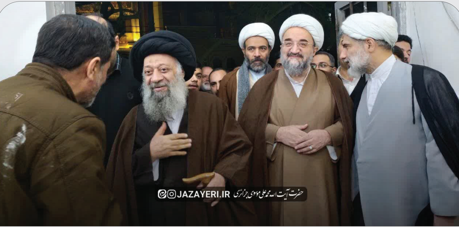
حضرت آیت الله موسوی جزایری

همزمان با سالروز ولادت با سعادت حضرت فاطمه زهرا (س) شبستان جدید مسجد فاطمیه اهواز با حضور زعیم حوزه های علمیه استان حضرت آیت الله موسوی جزایری و حجت الاسلام آقایی معاون شورای ائمه جمعه کشور افتتاح شد.